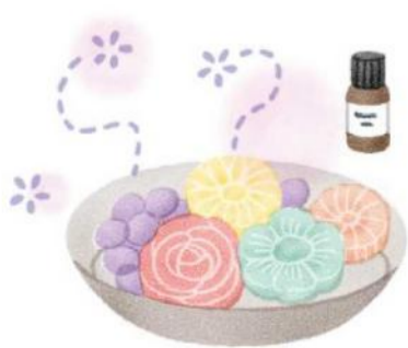
アロマオイルを垂らして使うストーンや、スティックから香りが広がるリードデフューザーなど、見た目も楽しめるものを。

香りには好みがありますが、家族の苦手な香りは避け、みんなが心地よく過ごせるものを選ぶのがベスト。おすすめは、すっきり爽やかなミント系の香りや、せっけんなどの清潔感のあるもの。インテリアのテイストにあわせるのもいいですね。