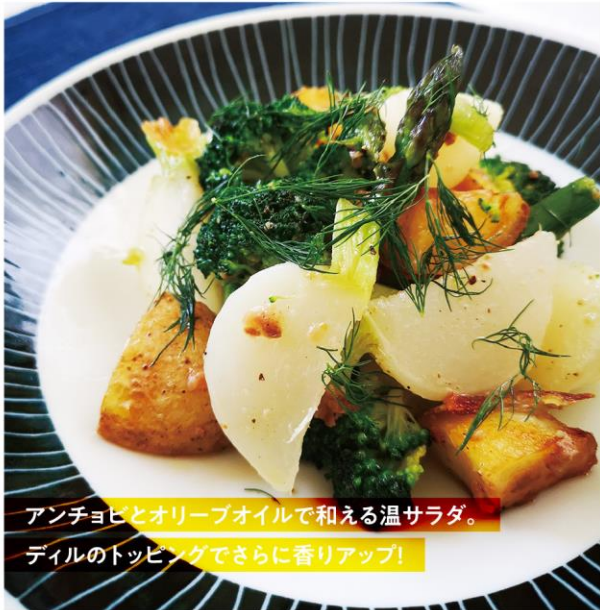
アンチョビとオリーブオイルで和える温サラダ。