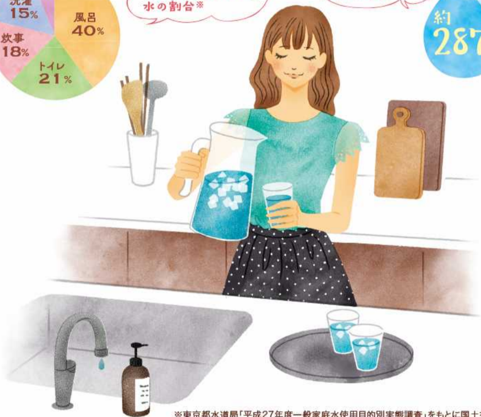
※東京都水道局「平成27年度一般家庭水使用目的別実態調査」をもとに国土交通省水資源部作成